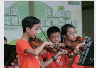
信義房屋節能無電體驗

信義積極回應SDG目標，確保永續的消費與生產模式，採取可永續發展的業務模式，持續宣導永續發展觀念。我們導入並通過「ISO20121永續活動管理系統」查證，於2017年7月通過第三方查證，率先成為全球第一家通過ISO 20121查證之連鎖服務企業。以永續發展為主軸考量ESG及供應鏈各面向的影響，透過PDCA的手法，實現組織辦理活動時達到永續發展之目標。未來信義門市籌辦活動將依循永續精神及永續條款、準則，從規劃到執行全程考量利害關係人所關切的議題，做出適切的回應。並向客戶、同仁、供應商、社會大眾等各利害關係人宣導永續發展資訊與意識，確保永續的消費與生產模式，共同達成永續經營。